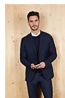
NEOBLU MARIUS MEN