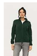
SOL'S FACTOR WOMEN 03824