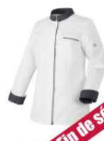
Blanc - Denim