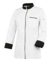
Blanc - Noir