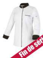
Blanc - Moka