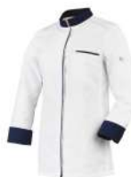
Blanc - Marine