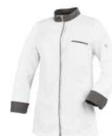
Blanc - Anthracite