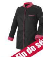
Noir - Fuchsia